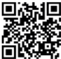
Film Stadt Frauenfeld