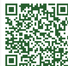
Weitere Unterlagen und Plan Frauenfeld